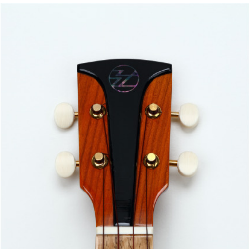
ウクレレヘッド部の青貝塗

ウクレレには、伝統技法の「拭き漆」仕上げのものと、ナチュラルラッカー仕上げのものがあります。どちらも杓目の美しさを引き出しています。